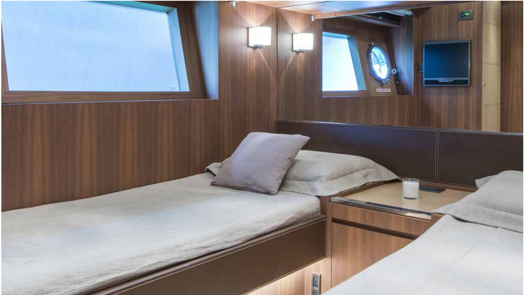
09. Guest cabin