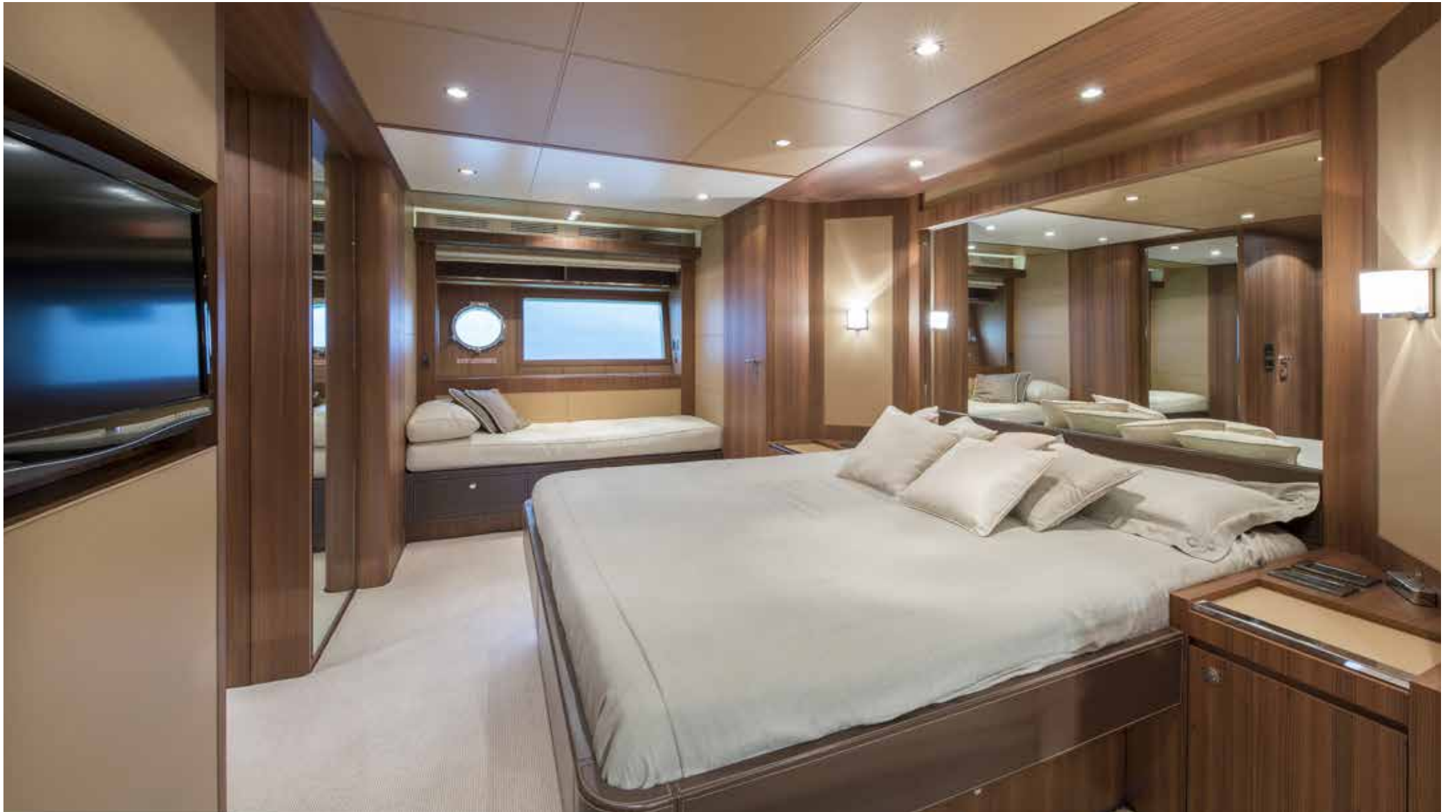
07. Owner's cabin