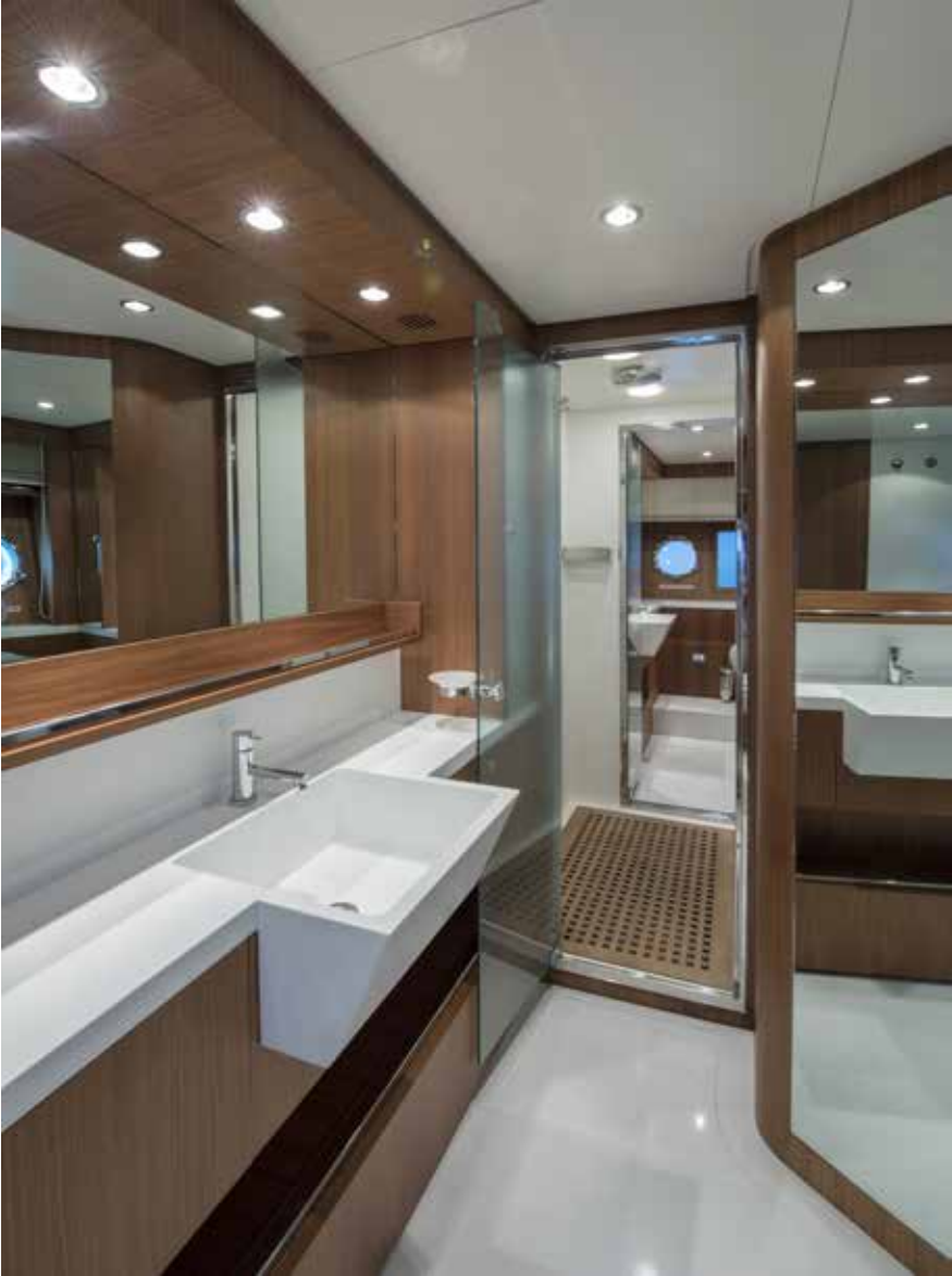
08. Owner's bathroom