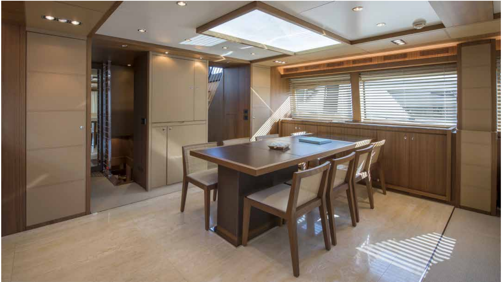
06. Dining area